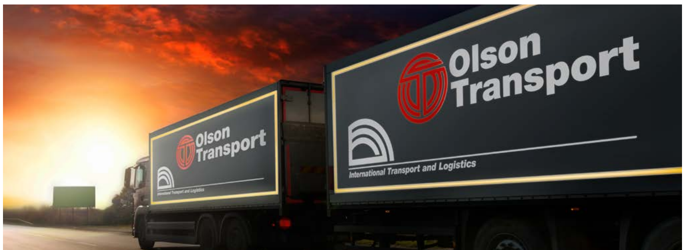
Avery Dennison V-4000 aplicado en trailer de camiones cumple con la regulación ECE104.

RENUNCIA DE RESPONSABILIDAD - Todas las afirmaciones, la información técnica y las recomendaciones de Avery Dennison se basan en pruebas que se consideran fiables pero no constituyen una garantía. Todos los productos de Avery Dennison se venden con la suposición de que el comprador ha determinado de forma independiente la aptitud de tales productos para sus fines. Todos los productos de Avery Dennison se venden sujetos a los términos y condiciones de ventas estándar, ver http://terms.europe.averydennison.com