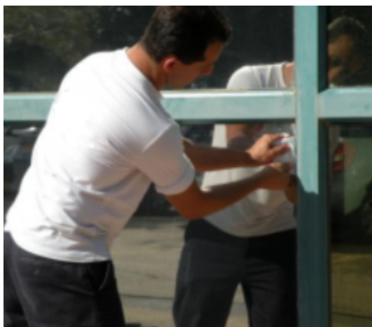
Paso 13 - Seque los bordes del film y la ventana utilizando un cartón envuelto en papel absorbente.