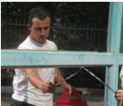
Paso 11 - Retire los trozos cortados.