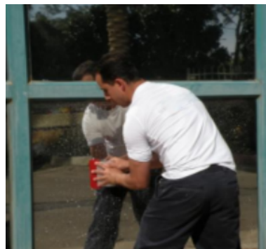
Paso 12- Vuelva a humedecer la superficie del film y presione con fuerza con la espátula desde el centro hacia los bordes hasta que no queden burbujas de aire o agua en los bordes.