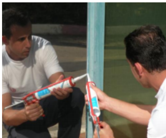
Paso 14 - Sellado de bordes: Deje secar el film durante 24 horas y complete el sellado de los cuatro bordes en un plazo de 72 horas.